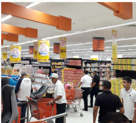
Área de cajas

Gracias a los excelentes resultados que se obtuvieron con la implementación del nuevo sistema de iluminación en la tienda Chedraui , se comprobó una mejoría en el tráfico de clientes diarios en piso solicitando la proyección de la iluminación del resto de las tiendas en México con luminarias SUPRA .